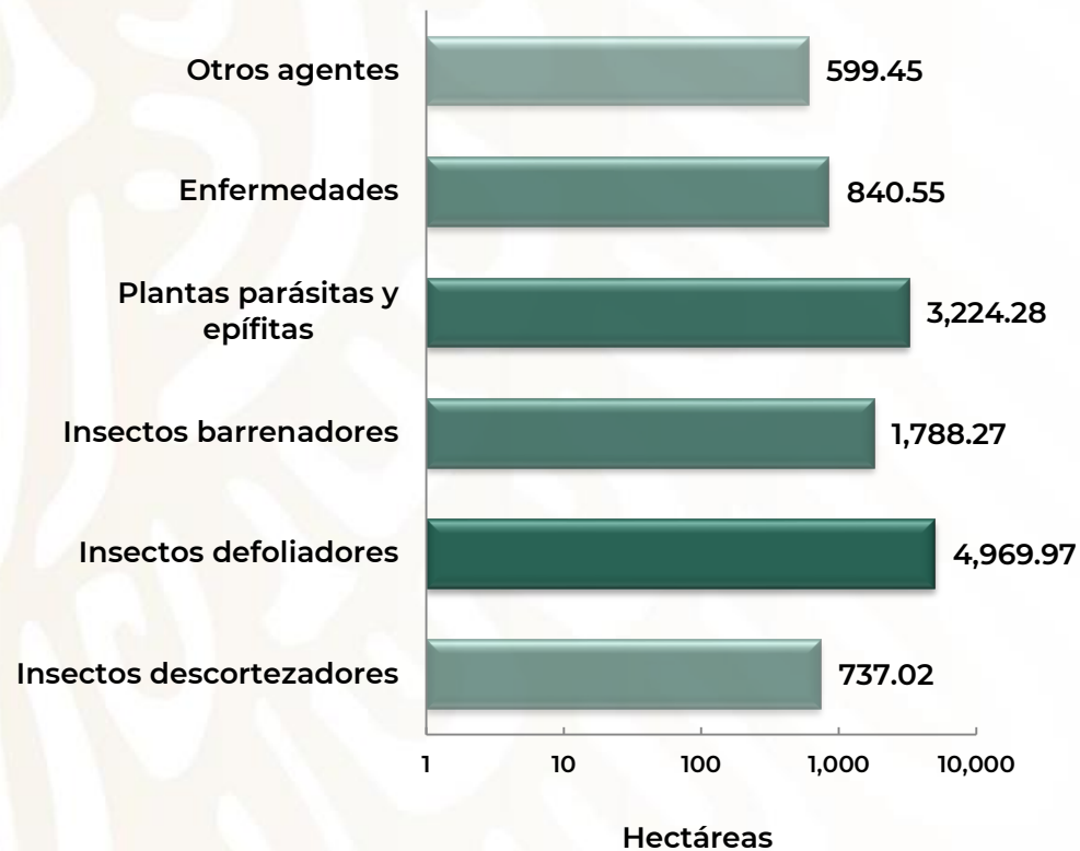
Superficie apoyada por Grupo de Agente Causal